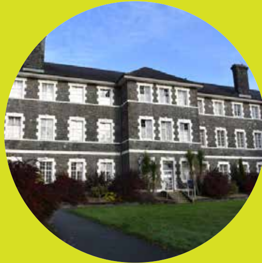
Parc Dewi Sant