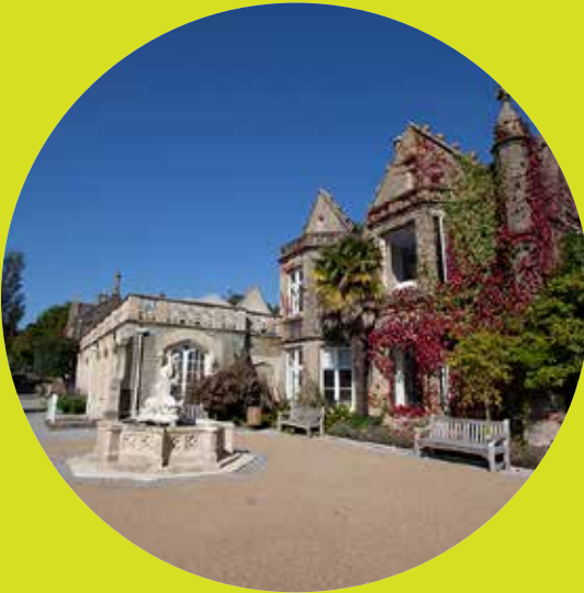
Campws Parc Singleton